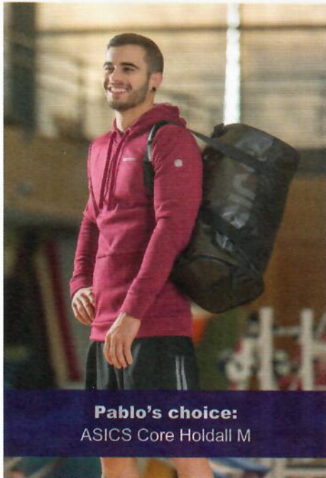
Pablo's choice: ASICS Core Holdall M